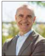
アントニオ・ムニョス セビリア市長

第47回ジャパンウィークが当地で開催されることに市長として御礼申し上げますと共に大変光栄な事と感じております。日本とセビリアは1614年慶長遣欧使節団の歴史的な訪問に始まり、現在もコア・デル・リオにはハボン姓のその子孫が多く暮らしているなど密接な関係を保ち続けております。そのセビリアで街を象徴する歴史的な遺産を会場として開催されるジャパンウィークはきっとセビリアの歴史と日本の文化を見事に融合させ、両国の友好・親善を益々深めることとなるでしょう。皆様にお会いできることを楽しみにお待ちしております。