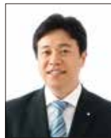
鶴保 庸介 公益財団法人 国際親善協会 会長

2022年の第47回ジャパンウィークは、スペイン・日本両国のコロナウイルス対策法令・ガイドラインに準拠し、規模を縮小し、第48回ジャパンウィーク2023年のプレイベントとして開催いたします。2020年・2021年とジャパンウィークを開催中止させていただきましたが、その間も国際交流の再開に向けて準備を進めて参りました。スペイン・セビリアで皆様にお会いできることを楽しみにしております。