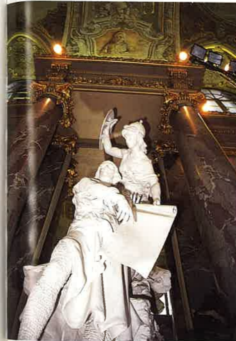
トゥールーズ市庁舎