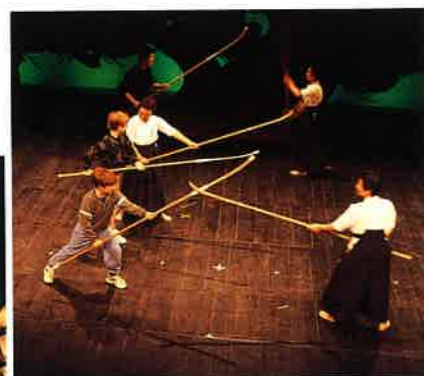
会津なよたけなぎなたクラブ