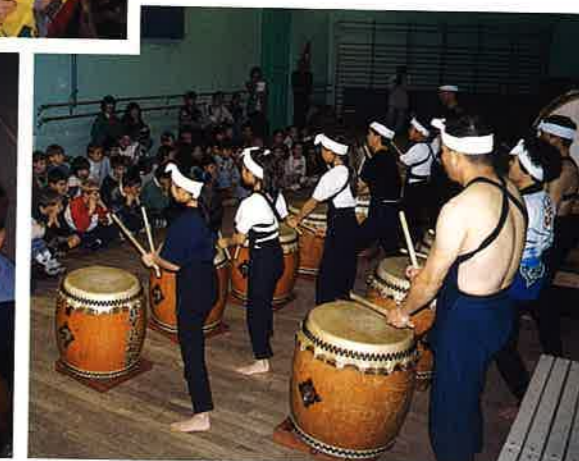
美幌岬太鼓保存会