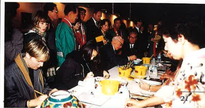
九谷の町寺井文化使節団