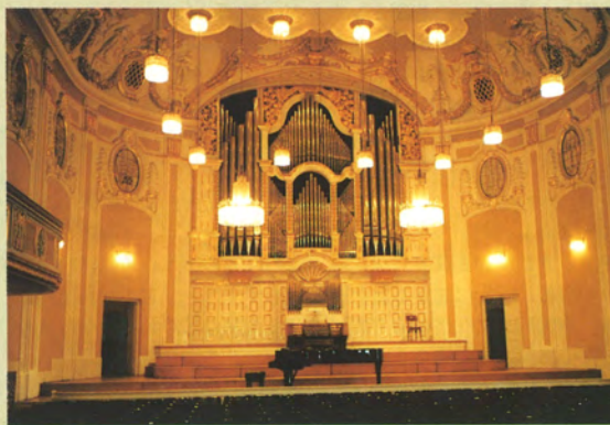
モーツァルテウム大ホール

開催地：オーストリア共和国・ザルツブルグ市 開催期間：1995年11月3日～11月10日(8日間)