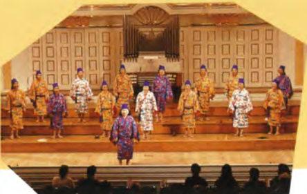
女声コーラスみなつき