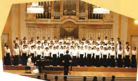
三重・パルクフィアー