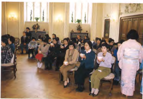
茶道研究知足会 (今回は国際交流訪問団として参加)