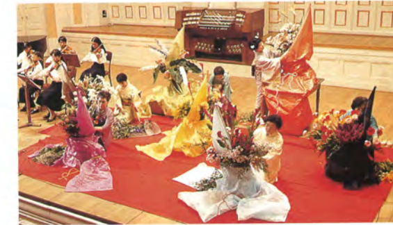
真派青山流青山会