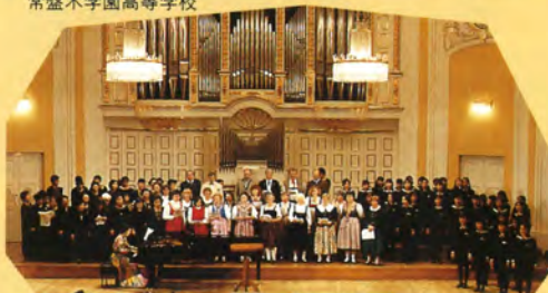
地元コーラスグループ、カマーショル・ サンクト・ピテュスとの感動的なフィナーレ