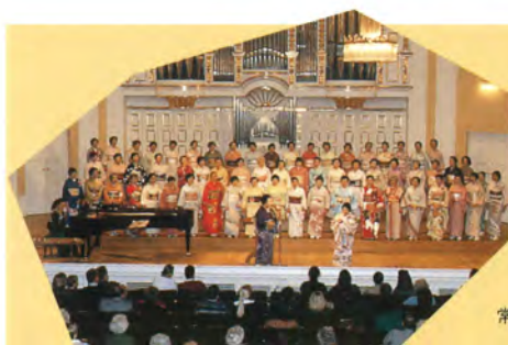
赤とんぼ童謡唱歌愛唱会