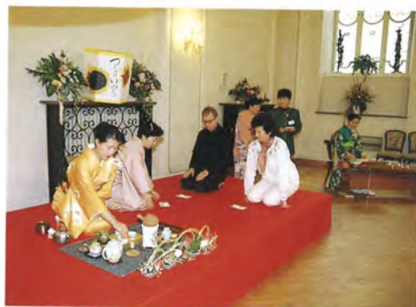
財団法人煎茶道方円流