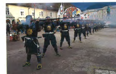
岩国藩石田流鉄砲隊保存会