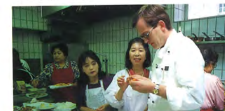
バランスクッキンググループ (料理交流)

様々な場所や施設を訪問して、一人一人が民間親善大使としてザルツブルク市民との交流を図るのがプログラムの目的。今回は文化は違っても共通の趣味や興味を持った団体との交流が中心となったため話題は尽きなかった。