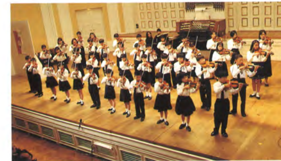
松本才能教育研究会