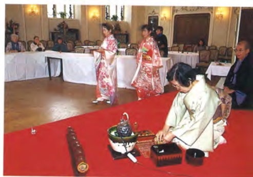
大日本茶道学会芙蓉会