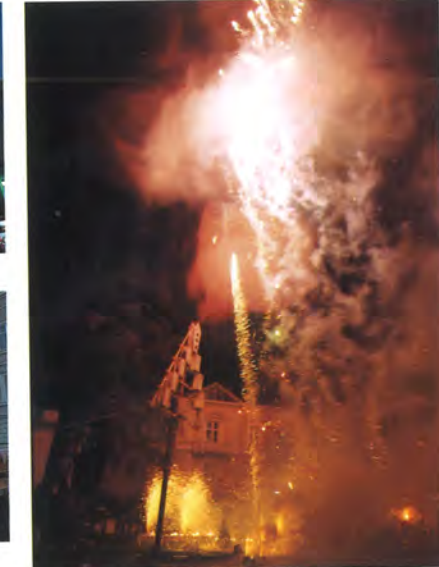
岐阜火祭実行委員会