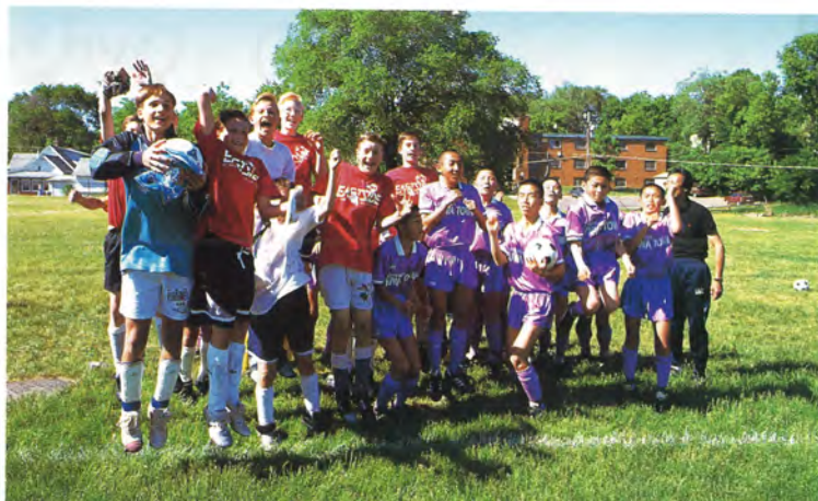
'94 アメリカジャパンウィーク・日米サッカー交流試合より

昨年、ヨーロッパ三大カップの一つであるUEFA杯でインテル・ミラノに惜しくも敗れたものの、堂々の準優勝に輝いたカジノ・ザルツブルグチーム。カジノ・ザルツブルグは各年令ごとのジュニアチームを持っており、今回は、このジュニアチームとの交流試合を行なう日本の青少年のサッカーチームを募集。また、トップクラスの選手によるサッカー教室も実施の予定。