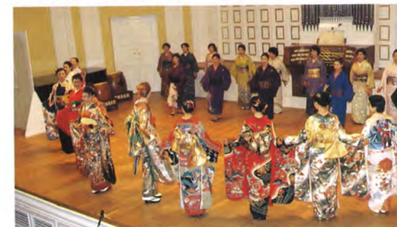
松本きもの研究会