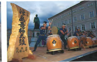
北檜山町浮島龍神太鼓保存会