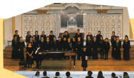
オ・タッシャーズ・シブヤ