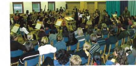
グローバル・フィルハーモニック・オーケストラ (学校訪問)