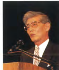
黒川 剛 第10回ヨーロッパジャ パンウィーク名誉顧問／在 オーストリア日本国大使 館特命全権大使