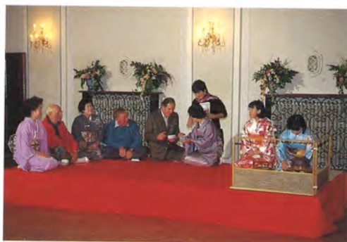
表千家同門会長野県支部佐久地区有志