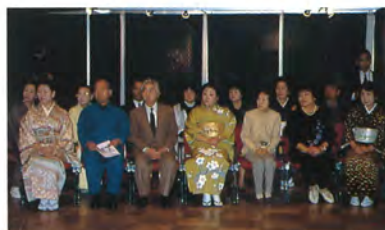
参加団体代表出席者