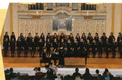
常盤木学園高等学校