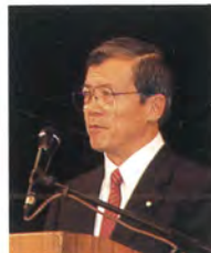
愛知 和男 第10回ヨーロッパジャ パンウィーク日本側実行委 員長／衆議院議員／財団 国際善協会会長