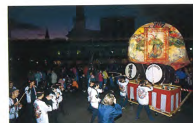
津軽ねぶた歴史研究会

ジャパンウィークを盛り上げる数々の野外公演。突然の悪天候のためいくつかのプログラムが中止になるという残念なハプニングもあったが、パワーあふれるパフォーマンスは間違いなくザルツブルク市民を魅了していた。