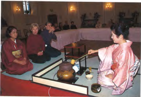
社団法人茶道裏千家淡交会会津支部