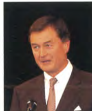
ヨーゼフ・デハント 第10回ヨーロッパジャ パンウィーク・オーストリ ア側実行委員長／ザルツ ブルク市長