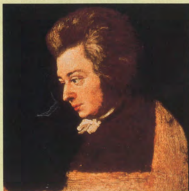
W. A. モーツァルトの肖像