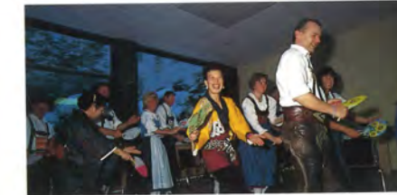
社団法人日本フォークダンス連盟 (ダンス交流)