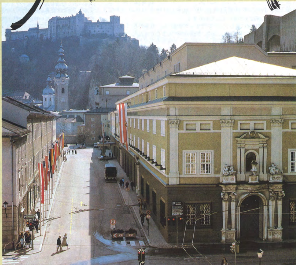
ザルツブルグ音楽祭の会場となる祝祭劇場