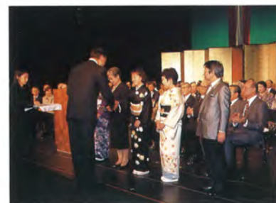
参加証書授与・華乃会（中央）ほか