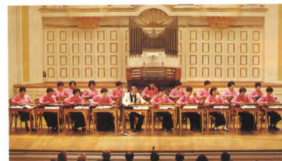
木村流全日本大正琴指導者協会