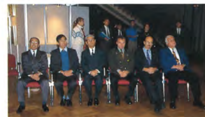
日横両国実行委員代表出席者