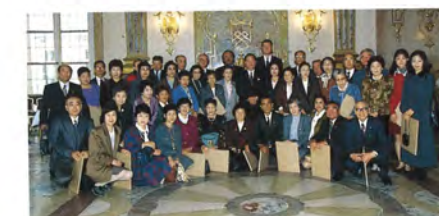
川崎市民交流団 (市庁舎訪問)