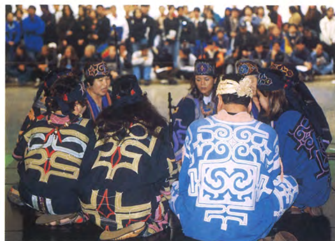
釧路リムセ保存会

野外公演の会場は冬にはスケートリンクになるロブソン・スクエア・コンファレンス・センターのリンクプラザ。メイン会場の入り口でもあるので、公演時は多数のジャパンウィーク見学者が足を止めて観賞。また、ニュー・ウエストミンスター市パイプバンドや有志参加者による御輿など現地からの団体も参加・協力するなど、観客・市民を交えての活気あふれる公演が披露されました。