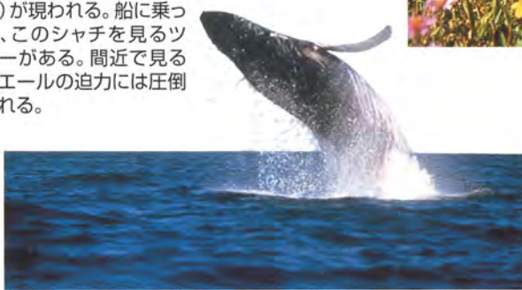
▼ホエールウォッチング 5月頃からビクトリア近海にキラーホエール(シャチ)が現われる。船に乗って、このシャチを見るツアーがある。間近で見るホエールの迫力には圧倒される。