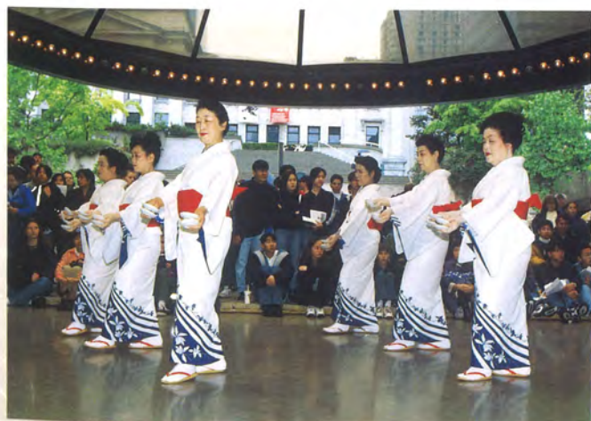
中山会(中山民俗舞踊研究所)