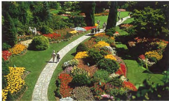
▲ブッチャートガーデン 6万坪を超える敷地内に、バラ園、サンクンガーデン(見晴らし台)や世界各地の花木を集めた庭園。ギフトショップやレストランもある。