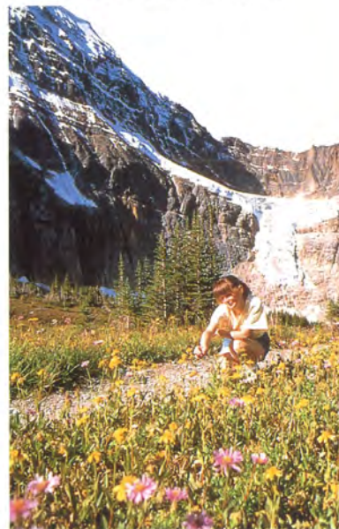
▲ジャスパー ハイキングや釣りといった、アウトドアライフを楽しむのに最適な街。ジャスパー国立公園の中にあり、カナディアンロッキー観光第2の拠点。