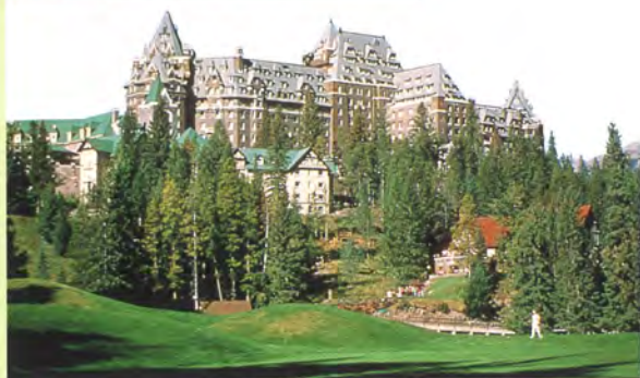
▲バンフ・スプリングス・ホテル カナディアンロッキー観光の拠点としてよく利用されるホテル。西洋のお城のような古風な外観だが、1996年にオープンしたスパリゾートのほか、ショッピング街や各種スポーツ施設などを持つ。