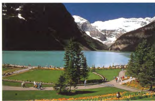
◆レイクルイーズ カナダの自然美を代表する景勝地の1つ。湖の北側を小1時間で回れる道がある。また周辺一帯には、自然を満喫できる散策コースが数多くある。