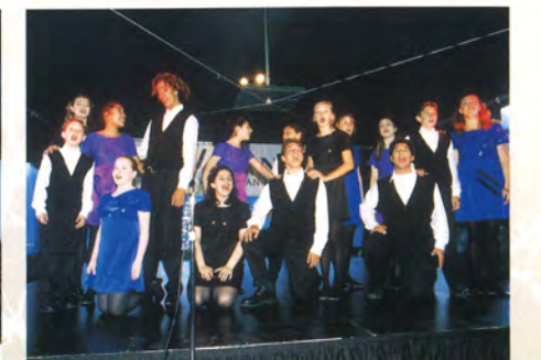
サウンド・センセーション