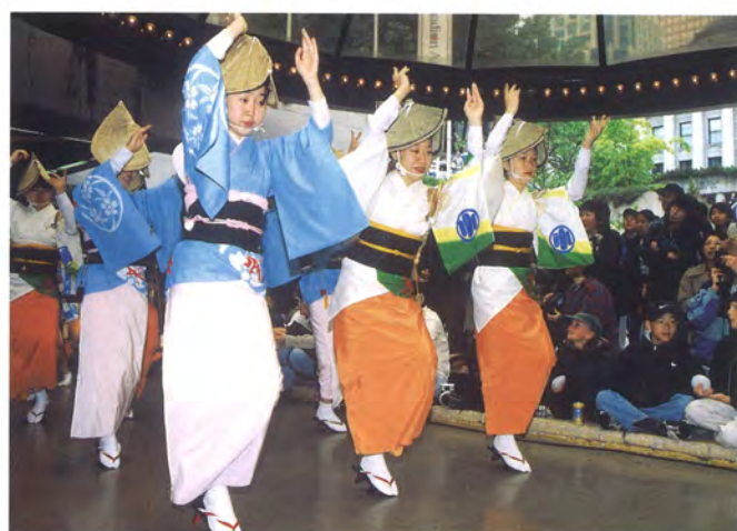
三鷹阿波踊り振興会