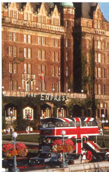
◆エムプレスホテル 街の中心地、ダウンタウンのインナーハーバーに面する由緒あるホテル。ビクトリアの観光名所へのアクセスが便利で、ホエールウォッチングの高速船もホテル前の港から出航する。