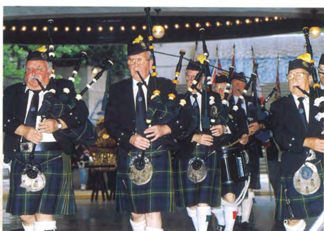
ニュー・ウエストミンスター市パイプバンド