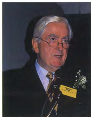
パトリック リード