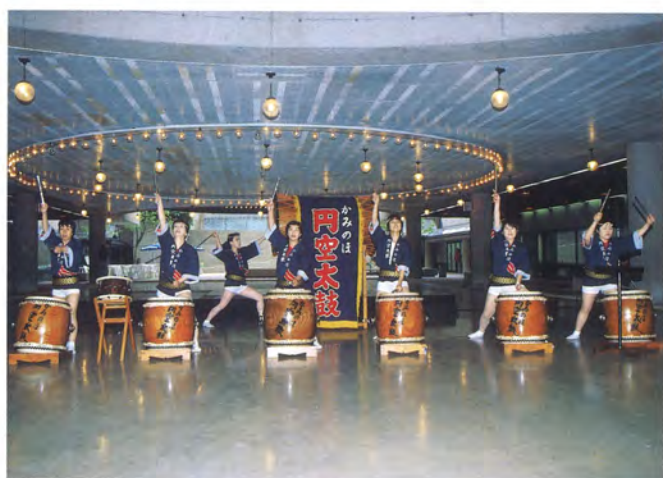
かみのほ円空太鼓