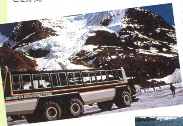
◆コロンビア大氷原 面積325平方キロ、北極圏に次ぐ広さの大氷原で、6つの氷河を有する。その内の1つ、アサバスカ氷河をまわる雪上車(スノーコーチ)ツアーが人気。